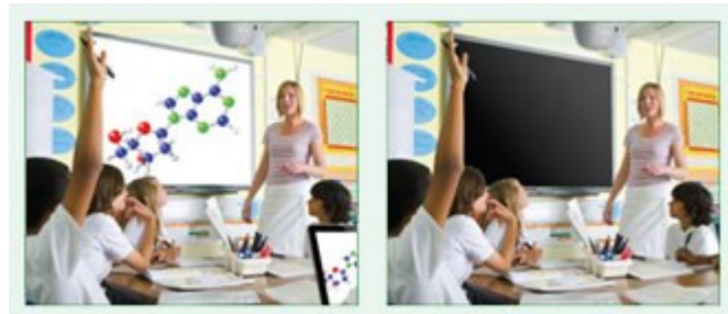
Eco AV Mute aus 100% Stromverbrauch

Behalten Sie während Ihrer Präsentation mit der ECO-AV-Mute-Funktion die Kontrolle. Richten Sie die Aufmerksamkeit Ihres Publikums durch Ausblenden weg von der Leinwand, wenn das Bild nicht benötigt wird. Dies reduziert den Stromverbrauch unmittelbar um 70%, und verlängert darüber hinaus die Lebensdauer Ihrer Lampe.