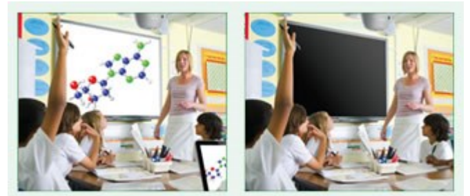
Eco AV Mute Funktion aus 100% Stromverbrauch

Behalten Sie während Ihrer Präsentation mit der ECO-AV-Mute-Funktion die Kontrolle. Richten Sie die Aufmerksamkeit Ihres Publikums durch Ausblenden weg von der Leinwand, wenn das Bild nicht benötigt wird. Dies reduziert den Stromverbrauch unmittelbar um bis zu 70%, und verlängert darüber hinaus die Lebensdauer Ihrer Lampe.